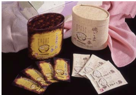
ふりかけ小袋セット