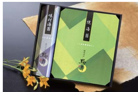
焼のり・味付のり詰合せ

内容量：焼のり5枚×3袋(板のり15枚分)、味付のり8切5枚×10袋(板のり6.25枚分)