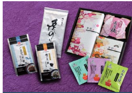
季彩きさい(梅)セット

内容量：焼のり5枚(板のり5枚分)、うめ干し100g、磯ごま一番40g、ごまかつお一番27g、フリーズドライみそ汁3袋(ほうれん草・揚げなす・オクラ)